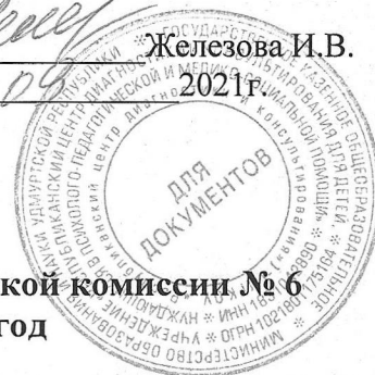
График работы территориальной психолого-медико-педагогической комиссии № 6 (г. Можга) на 2021-2022 учебный год